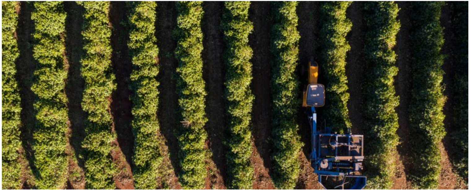
O Ministério da Agricultura e Pecuária terá R$ 5,01 bilhões no âmbito do Fundo de Defesa da Economia Cafeeira para o financiamento da safra 24/25 — Foto: Reprodução.

Outro critério é o percentual de aplicação dos recursos contratados pela instituição financeira com os beneficiários das linhas de crédito, também em relação ao valor contratado.