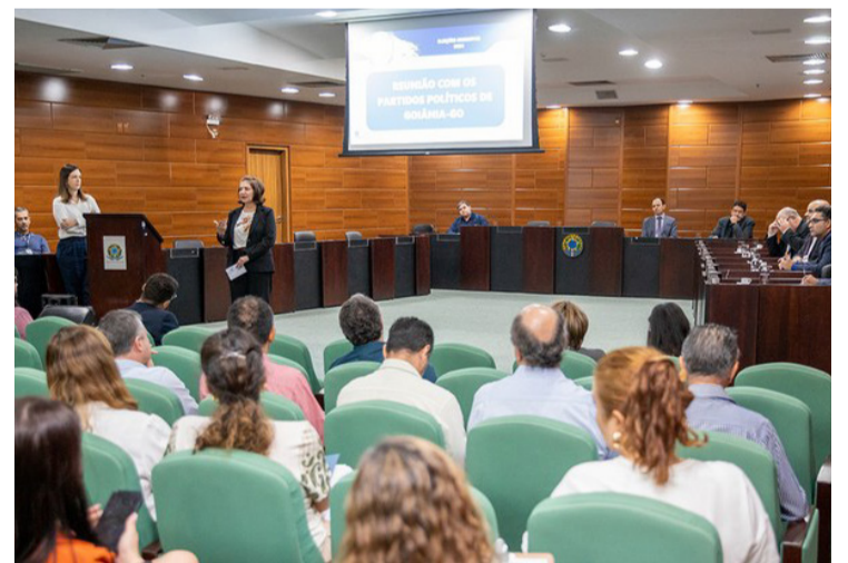
Juízes eleitorais e presidentes de partidos políticos