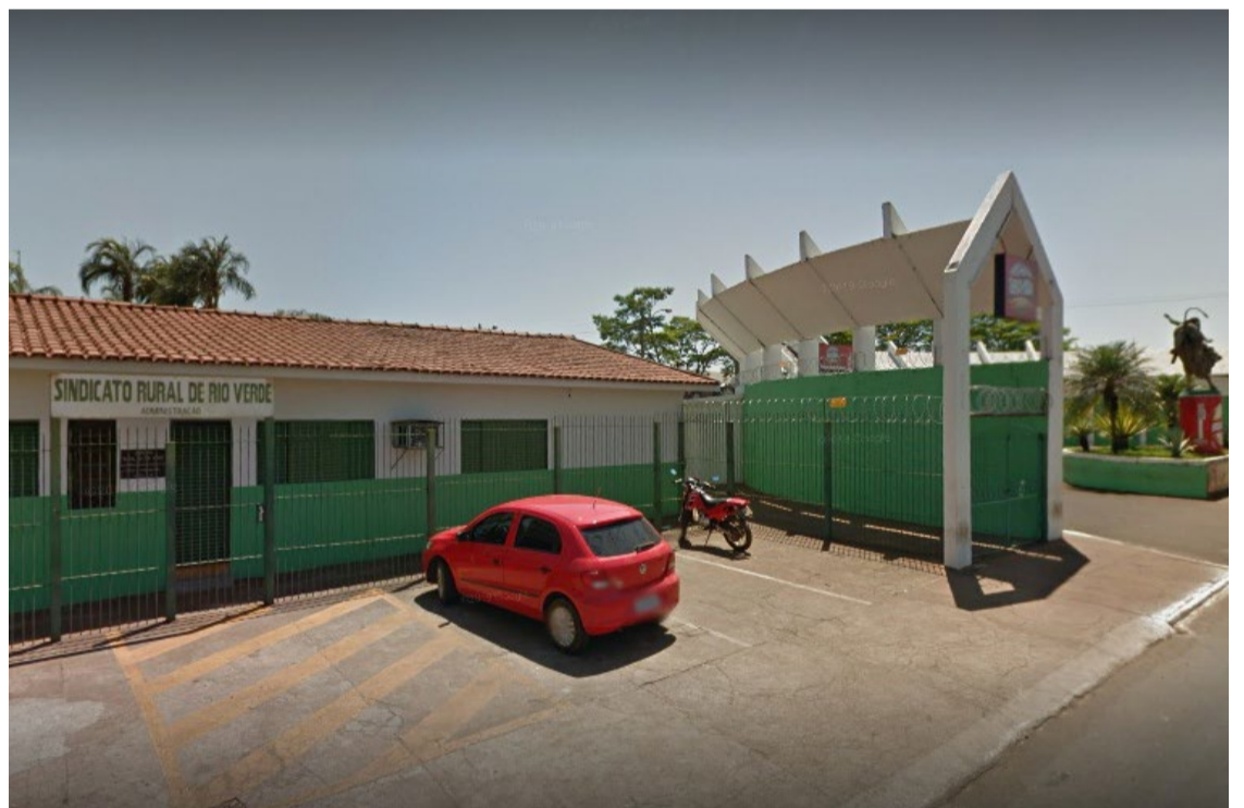
Sindicato Rural de Rio Verde terá uma equipe para auxiliar o associado a emitir a Declaração do Imposto sobre a Propriedade Territorial Rural — Foto: Reprodução.

Para auxiliar os produtores, o Sindicato Rural montou uma equipe de servidores que ficarão à disposição dos associados para o esclarecimento de dúvidas e para a realização da declaração. Para ter acesso a esse benefício, é necessário apenas a realização do agendamento de atendimento através do telefone 64 3051-8700.