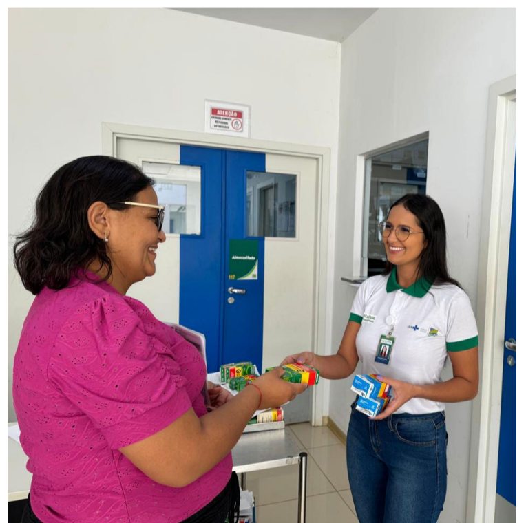
Policlínica de Quirinópolis distribui medicamentos de alto custo a pacientes de 28 municípios do Sudoeste goiano