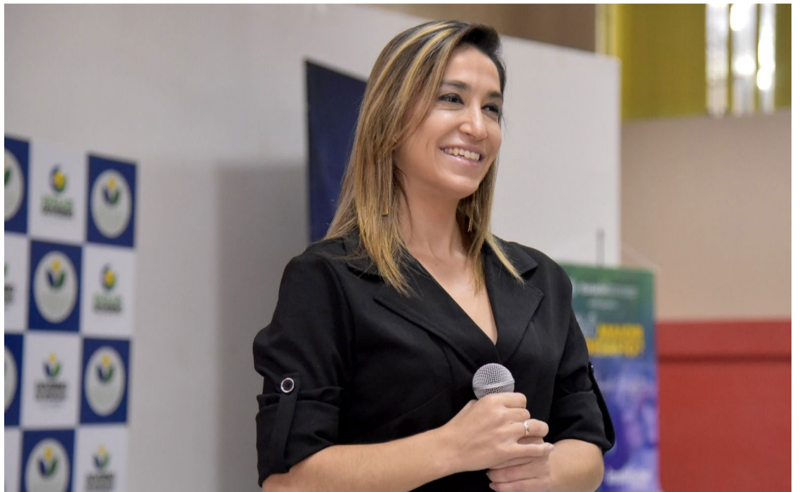
A campeã olímpica Daniele Hipólito será uma das palestrantes na Sudoexpo 2024 — Foto: Reprodução.

A Sudoexpo 2024 acontecerá entre os dias 11 e 14 de setembro de 2024, e já conta com 180 estantes participantes no evento. Na última edição, a Feira atraiu cerca de 40 mil visitantes. Agora, com novo local definido, que será no Teatro Lauro Martins, a expectativa é que o público seja maior.