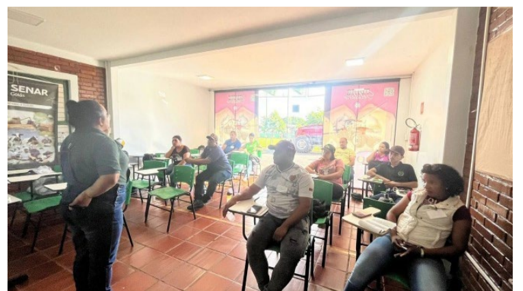
Anualmente, o Sindicato Rural realiza aproximadamente 400 cursos e treinamentos — Foto: Reprodução.

cursos de análise e classificação de grãos de soja e milho (12 a 14 de agosto); uso de drone para monitoramento em áreas agropecuárias (12 e 13 de agosto); avicultura de corte tecnificada (12 a 15 de agosto); manejo de plantas daninhas - pastagens (15 e 16 de agosto); prevenção de acidentes com defensivos agrícolas - NR31.8 (15 a 17 de agosto) e operação de GPS (16 e 17 de agosto). Para participar, os interessados devem realizar inscrição por meio do telefone: (64) 9286-9221.