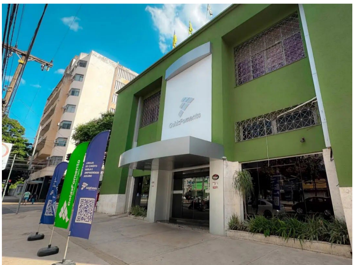
Sede da GoiásFomento na Avenida Goiás, em Goiânia, está de portas abertas para o empreendedor goiano

“É ordem do governador que possamos atender os microempreendedores individuais (MEIs), micro e pequenos empresários goianos. E a GoiásFomento tem sido exemplo para o Brasil nos seus programas, nas suas linhas de crédito, com juros extremamente acessíveis, de forma prática e objetiva”, destaca.