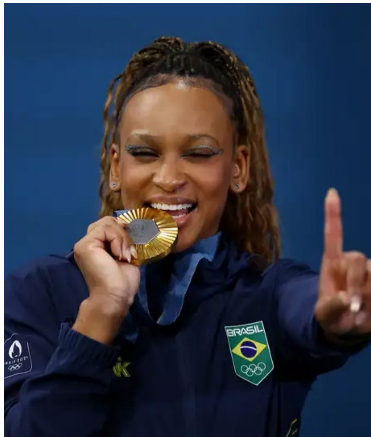
Em maior número na delegação, elas faturaram 60% dos pódios do país

Pela primeira vez em mais de cem anos de participações do país em Olimpíadas, a delegação do Brasil teve mais mulheres do que homens