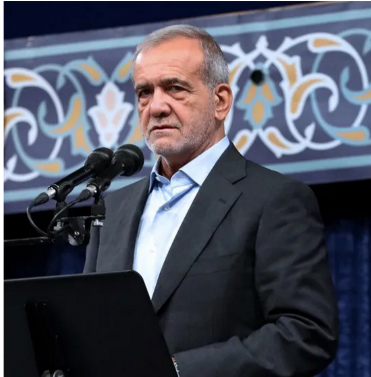
O Oriente Médio continua a ser um foco de tensão global envolvendo Irã, Israel e Estados Unidos

A decisão de Khamenei também reflete a complexa dinâmica política interna do Irã. O presidente Pezeshkian, considerado um centrista, tem buscado uma abordagem mais diplomática, contrastando com