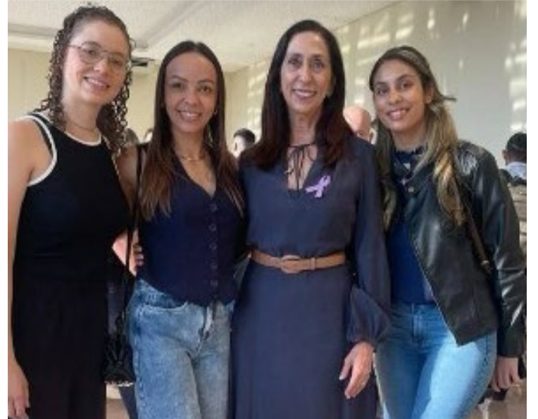
A primeira-dama de Rio Verde posa com participantes do Fórum SIPIA em Rio Verde.

O evento que foi realizado em parceria com o Conselho Municipal dos Direitos da Criança e do Adolescente (CMDCA), o Juizado da Infância e Juventude e a 8ª Promotoria de Justiça, destacou a importância do SIPIA para a melhoria das políticas públicas e o bem-estar infantil, consolidando um sistema integrado de proteção em Rio Verde.