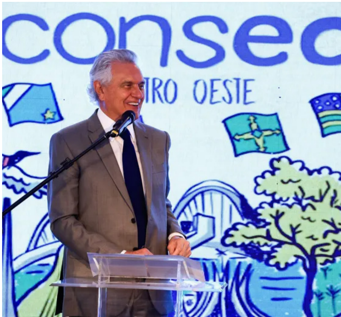
Segundo a sondagem de opinião pública, o chefe do Executivo é bem avaliado por 75% dos eleitores